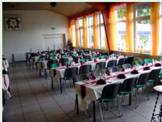
Vereinsheim bis 120 Personen

Volker Scheele 0 23 81 / 37 84 45 und 0176 / 15 90 67 09