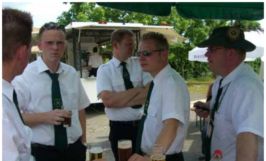
Ehemalige Könige unter sich