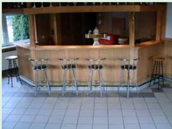
Avantgardenlaube bis 60 Personen

Besichtigungsmöglichkeit besteht freitags bis 19.30 Uhr