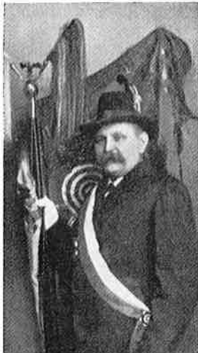
Kaufmann im Hammer Süden

Wer war der erste Fahnenräger des Schützenvereins Hamm-Süden (Süden-Feldmark) und übte dieses Amt 25 Jahre hintereinander aus?