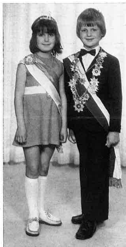
Kinderschützen- Königspaar '74

Montag, den 15. 7. 74: Baden in der Gaststätte Starkmann Caldenhofer Weg, ab 10.00 Uhr.